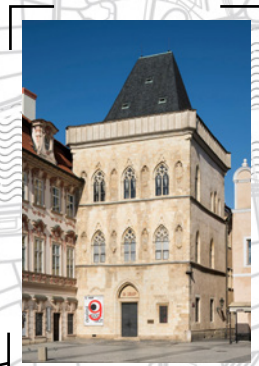
Dům U Kamenného zvonu