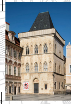
Будинок біля Кам'яного дзвону